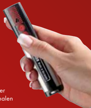
zender 4 kanalen