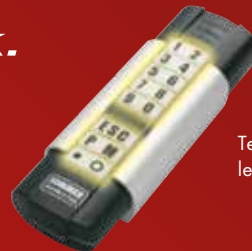
Telecody met ledverlichting